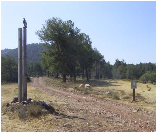
Rètol a Prat a la Vall d'Alinyà.

- S'han fet fer 16 rètols de 30 x 45 cms. a tres idiomes (català, castellà i francès) per anunciar la presència dels MPR'S en els ramats. Dos han anat destinats a la Vall d'Alinyà, fixes; 3 a les pastures de Martí Pubill de Casa Ainat a Forn, mòbils; 1 a Raul Alcaraz a Ossera, fixe; 2 a Bor (Cerdanya) mòbils; 2 a Montmalús (Cerdanya), fixes; 2 a Castellbó (Alt Urgell), mòbils; i 2 a Porqueres (Pla de l'Estany), mòbils.