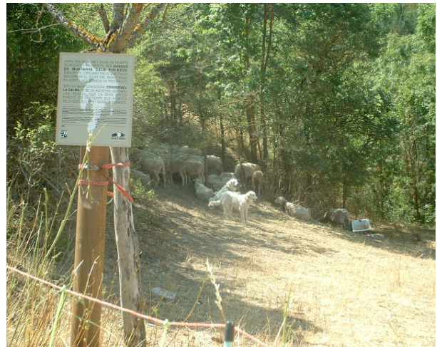
Un dels 2 rètols mòbils a Bor (Cerdanya)