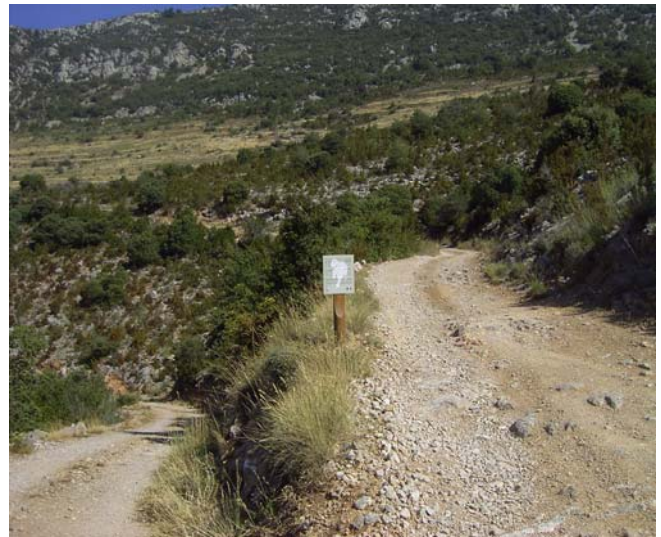
Rètol a Espugonera a l'encreuament dels camins que van al coll de la Nou i al coll d'Ares (Vall d'Alinyà).