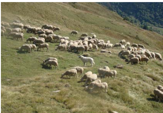
En Gaube muntant guàrdia al Clot dels Vinyals