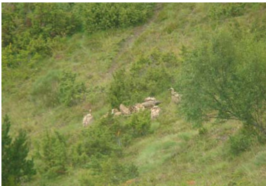
Voltors al Port de Salau