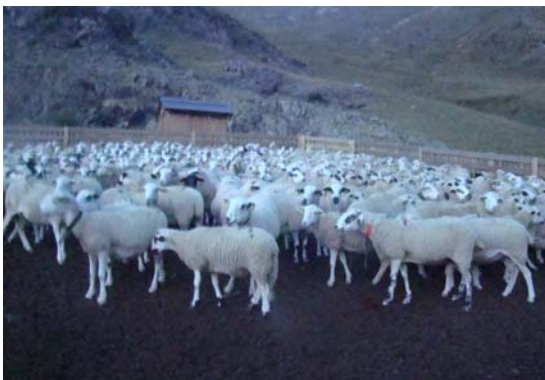
Ovelles a la pleta