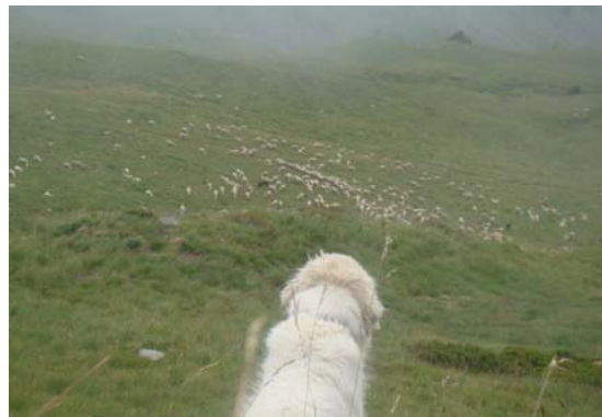
En Gaube controlant el ramat al Clot dels Vinyals