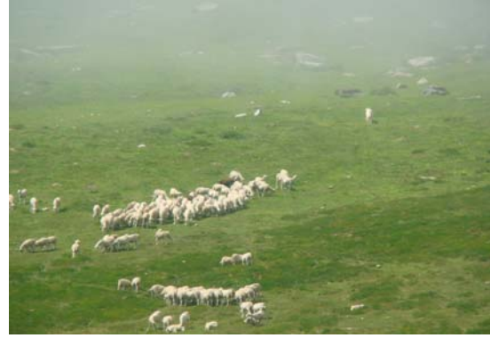
Coma dels Vinyals