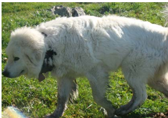
En Gaube amb el "collar de punxes" a la pleta

La segona observació, va ser la matinada del dimecres 25 d'agost. Encara no era de dia, tot just començava a clarejar i el dos gossos de protecció, en Gaube i la Burtxata de 5 mesos d'edat, bordaven molt seguit al costat del barranc de la Coma dels Vinyals, just on tenia la pleta amb el ramat i la meua cabana. En sentir-los ja feia estona, vaig llevar-me i els vaig cridar pensant que bordaven a una vaca, euga o guilla, però al sentir-me varen arrancar a corre cap a baix del barranc, tot seguit, vaig veure pujar un animal fosc per l'altre costat del barranc i vaig pensar que era un senglar, però no va ser fins que a l'arribar ell al terreny pla, vaig veure que no corria com un senglar i vaig agafar els prismàtics; va ser llavors que vaig poder contemplar a un exemplar d'os bru que fugia a tota velocitat empaitat pels meus dos gossos de protecció, ell corria i de tant en tant tombava el cap per mirar als seus perseguidors encara que sense perdre velocitat. En Gaube i la Burtxata es van aturar i varen continuar bordant força estona i l'ós va marxar tombant la carena en direcció al barranc de Salau. Aquell dia vaig engegar el ramat en aquella direcció i vaig estar pendent per si el podia veure un altre cop o podia trobar les seves petjades... però sense èxit.