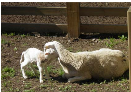
Ovella amb el seu xai acabat de néixer a la pleta

La segona observació, va ser la matinada del dimecres 25 d'agost. Encara no era de dia, tot just començava a clarejar i el dos gossos de protecció, en Gaube i la Burtxata de 5 mesos d'edat, bordaven molt seguit al costat del barranc de la Coma dels Vinyals, just on tenia la pleta amb el ramat i la meua cabana. En sentir-los ja feia estona, vaig llevar-me i els vaig cridar pensant que bordaven a una vaca, euga o guilla, però al sentir-me varen arrancar a corre cap a baix del barranc, tot seguit, vaig veure pujar un animal fosc per l'altre costat del barranc i vaig pensar que era un senglar, però no va ser fins que a l'arribar ell al terreny pla, vaig veure que no corria com un senglar i vaig agafar els prismàtics; va ser llavors que vaig poder contemplar a un exemplar d'os bru que fugia a tota velocitat empaitat pels meus dos gossos de protecció, ell corria i de tant en tant tombava el cap per mirar als seus perseguidors encara que sense perdre velocitat. En Gaube i la Burtxata es van aturar i varen continuar bordant força estona i l'ós va marxar tombant la carena en direcció al barranc de Salau. Aquell dia vaig engegar el ramat en aquella direcció i vaig estar pendent per si el podia veure un altre cop o podia trobar les seves petjades... però sense èxit.