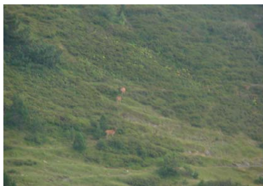
Tres cérvols al Barranc de Salau