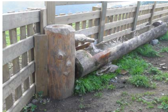
Abeurador a la pleta