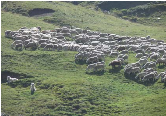
Clot dels Vinyals

En el mateix terme però al costat francès, hi havien dos ramats més en el Port de Salau, i l'ós ja havia mort una vintena d'ovelles per aquelles dates, i una xifra semblant a l'altre ramat del Port d'Aulà. En els dos ramats francesos no hi havien gossos de protecció, ni una pleta per fer-hi dormir les ovelles, sinó que pràcticament anaven soles tot el dia i dormien sense companyia de cap tipus. És evident que els ossos ho tenien molt més fàcil al costat francès que al costat català.