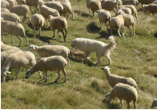
Clot dels Vinyals