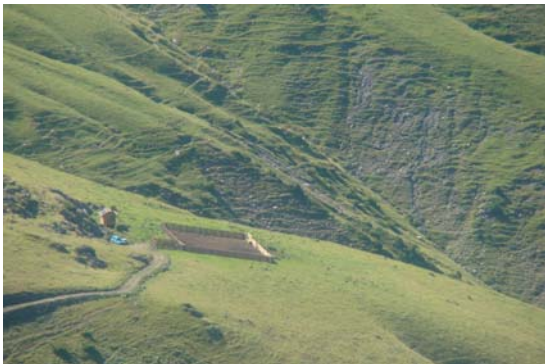
Pleta i cabana als Vinyals – Salau

Succeeix a les muntanyes pallareses de la Vall de Montgarri a l'Alt Àneu, des del Port de Salau fins a Serra Clavera passant pel Port d'Aulà. L'accés fins la cabana i la pleta en vehicle tot terreny, pujant per una pista des d'Alós d'Isil, amb 1 hora aproximada de trajecte.