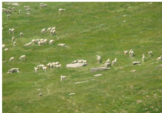
Clot dels Vinyals

Durant aquests tres mesos, fent tasques de guarda i protecció sota els auspicis de la Generalitat de Catalunya, del ramat de l'Alt Àneu compost per uns 1500 caps de bestiar de diferents propietaris, he tingut la oportunitat i la sort de poder veure l'ós en dues ocasions, dic sort, perquè no s'ha hagut de lamentar cap pèrdua de bestiar i perquè, com diu el meu pare, "té la gàbia molt grossa" i per tant és molt difícil de veure. Per altra banda, és un animal molt potent i astut, però també molt tímid i que evita les topades amb l'ésser humà.