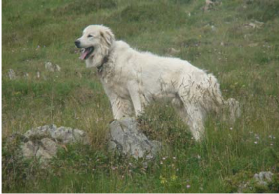
En Gaube damunt la pleta