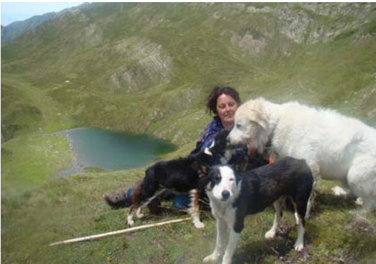
La Mercè amb l'equip