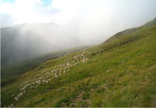
Prop del Port d'Aulà