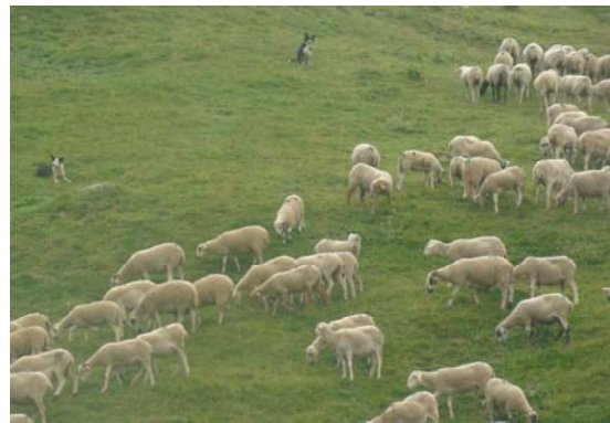
La Bam i la Uk controlant el ramat a la Serra de la Tinta

Per secundar la meua comesa em vaig emportar de casa dues gosses de conducció de ramats de la raça Border Collie: la Uk i la Bam, i dos gossos de protecció de ramats de la raça Muntanya dels Pirineus: en Gaube de la Borda d'Urtx de Cal Manistró i la Burxata Pulida de Casa Hostal de Cal Manistró