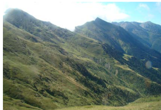
Barranc de Salau