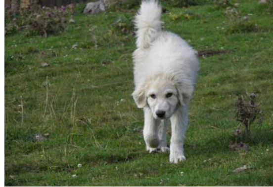
La Burxata Pulida damunt la pleta