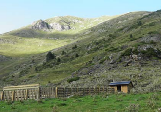
Pla de Salau

L'ós és un animal omnívor, el 70% de la seva dieta és vegetariana, però també necessita aliment de procedència animal com carronyes, ous, petits mamífers, etc... que caça si té la oportunitat, i la carn humana no figura en el seu menú.