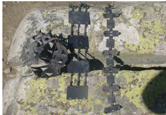
Collars de punxes construïts artesanalment per l'Armand